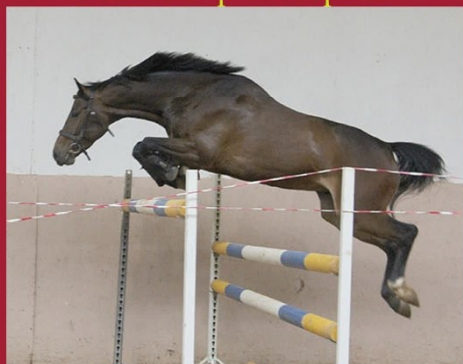
Лункан от Конкорда

РЕЗУЛЬТАТЫ ИСПЫТАНИЙ МОЛОДНЯКА 2019-2021 гг.