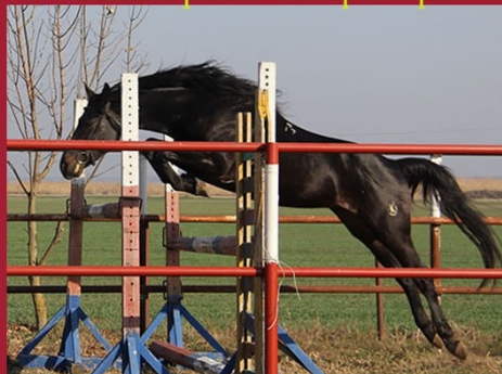
Подход от Ольгина