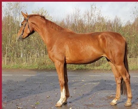
Палитра М от Прохора