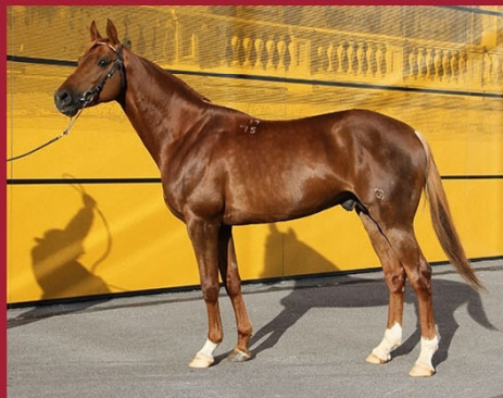
Репетитор от Хорала