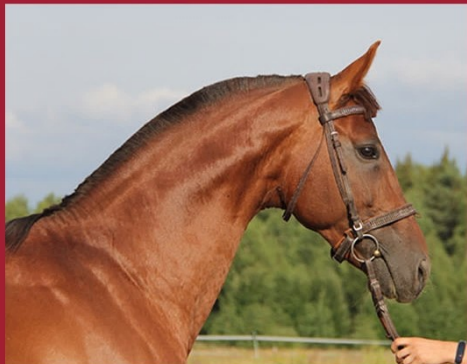
Алиготе Чемп от Армистея