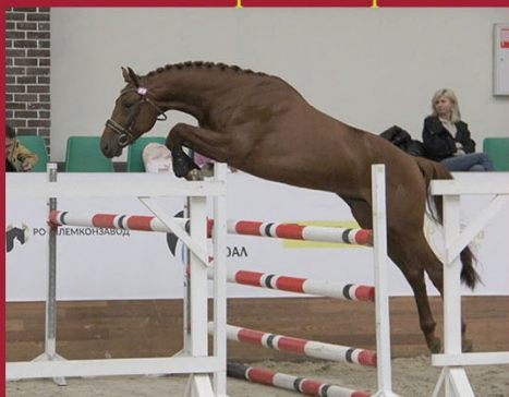
Парабеллум С от Братска хх