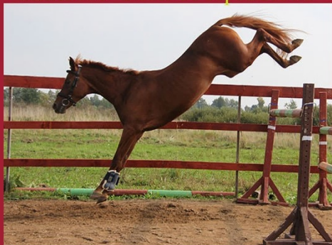
Перфекта от Фиатаса