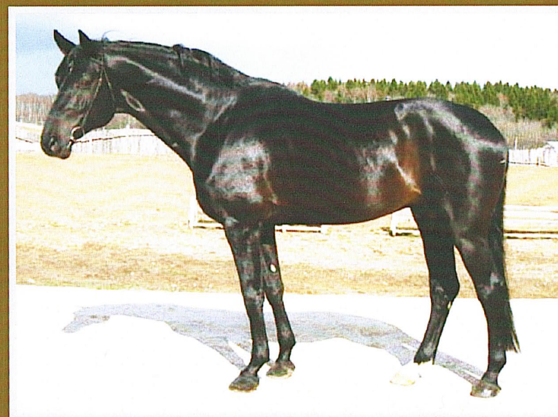
Тракененский ХЕМФРИС, т.гн., 1998 г.р. (Хеопсас – Хина), Нямунский к/з III место в группе «Лучших» по уровню развития двигательных качеств потомства