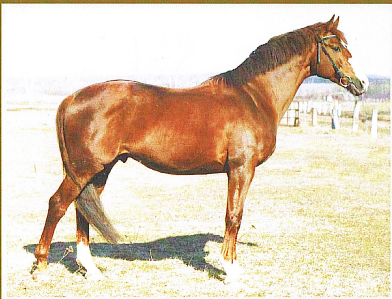
Тракененский ОРГАН рыж., 1992 г.р. (Грэт - Орхидея), Рязанский к/з

IV место в группе «Лучших» по уровню развития прыжковых качеств потомства