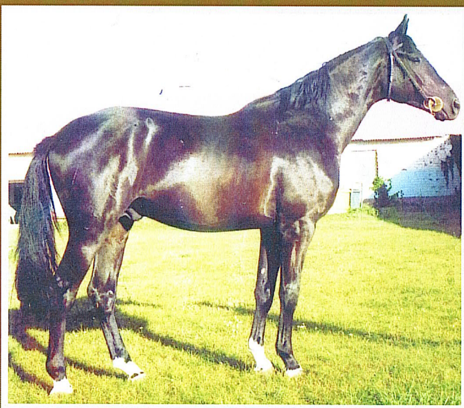
Тракененский ГАРВАРД, вор., 2006 г.р., (Визит – Гарда) в РЦОПКСиК I место в группе «Ценных» по результатам бонитировки потомства

ФЭБО , вор., ж., 1995 г.р., в Малоярославском ТД, прыжковые качества -8,9 б.