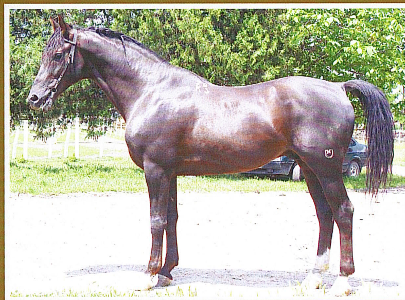
Тракененский 0134 ОРИОН 28, бур., 2003 г.р. (Ореол – Отважная), ЗАО «Кировский к/з» III место в группе «Ценных» по результатам бонитировки потомства