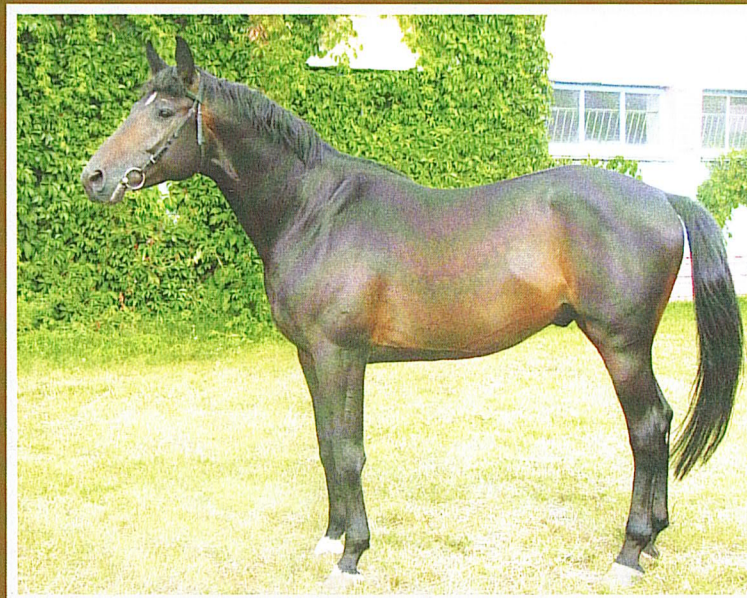
Тракененский ЭЛВИС, т.гн., 2002 г.р. (Вопрос Попутчика – Элис), РЦОПКСиК

IV место в группе «Лучших» по уровню развития двигательных качеств потомства