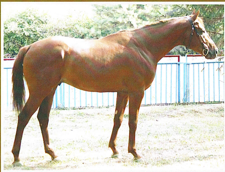
Чистокровный верховой ГРАММ, рыж., 2006 г.р. (Менигал – Галигастра), СПК «Октябрьский»

IV место в группе «Лучших» по уровню развития прыжковых качеств потомства