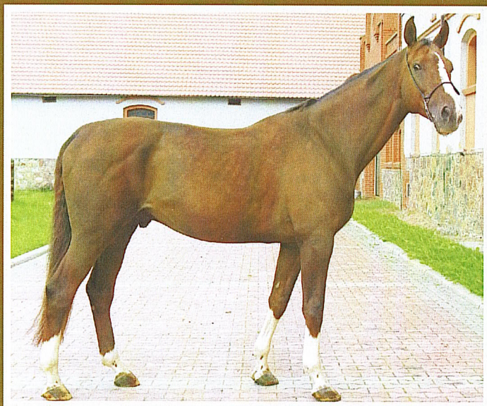
Ганноверский ВАНАДИЙ, рыж., 2003 г.р. (Ватерпас – Двиня), ООО «Веедерн» II место в группе «Лучших» по уровню развития двигательных качеств потомства