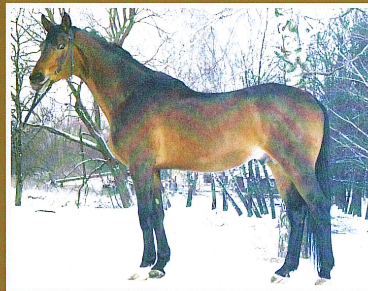
Тракененский ЭГЕЮС, гн., 1991 г.р., (Вольтерас – Этнолия), Нямунский к/з

III место в группе «Лучших» по уровню развития прыжковых качеств потомства